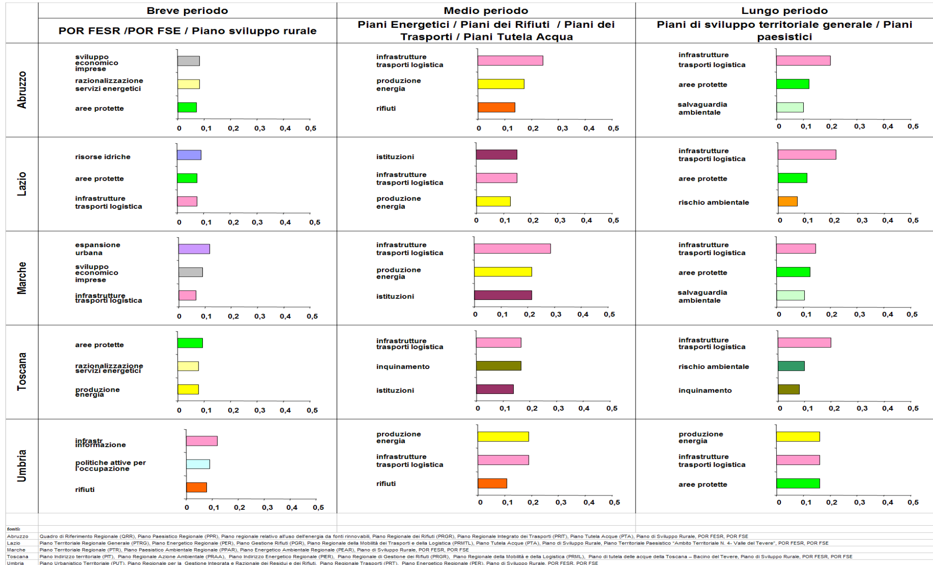
Figura 6 - Macroaree di intervento più rilevanti, per Regione e ambito di pianificazione